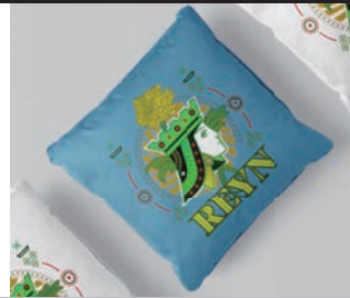
インテリアグッズ